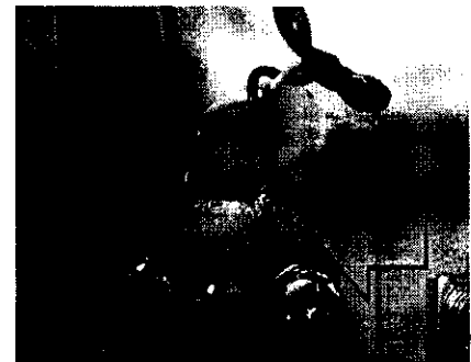
CIRCUITO DE CORRIENTE DETERIORADO (Shunt)