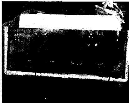
BLOQUE DE TERMINALES ROTO (En la parte inferior presenta riesgo eléctrico)