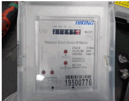
Placa de características