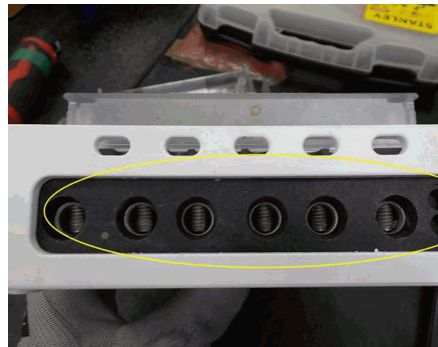
BLOQUE DE TERMINALES DETERIORADO (Tornillos de los terminales sulfatados)