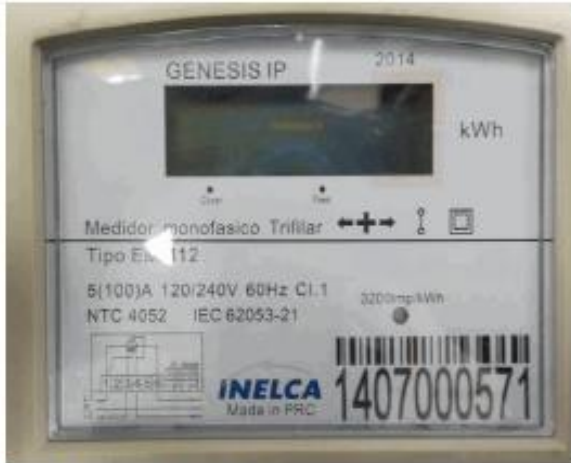
Placa de características