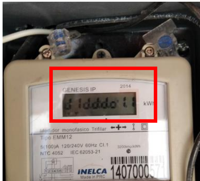
Foto No 5. Irregularidad hallada en el momento de la visita.