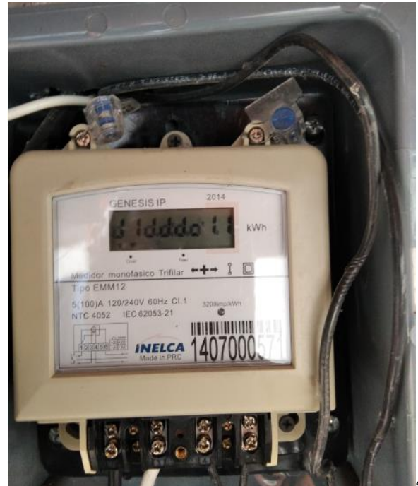
Foto No 3 y 4. Medidor encontrado en terreno número 147000571