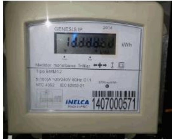
REGISTRADOR DETERIORADO (Pantalla LCD presenta segmento deteriorados, no es posible tomar lectura correcta)