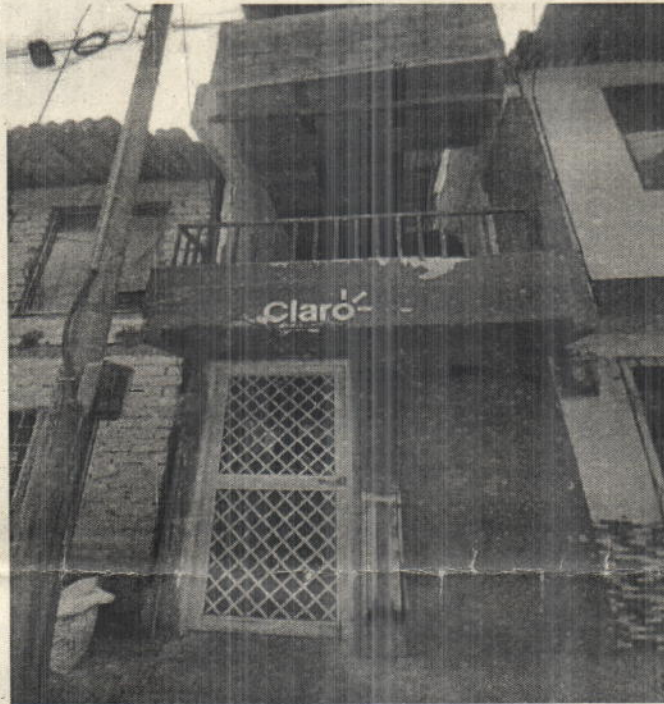
Foto No 1. Vincula el predio con la matrícula en revisión