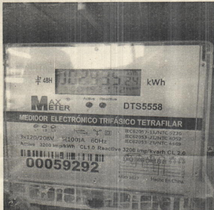
Foto No 2. Medidor No. 59292 encontrado en terreno instalado y energizado sin encontrarse registrado en el sistema comercial de la compañía con una lectura acumulada de 2935 kWh.