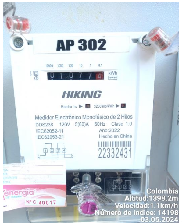
Foto No 8. Medidor No. 22332431 encontrado en terreno instalado y energizado sin encontrarse registrado en el sistema comercial de la compañía con una lectura acumulada de 1077.5 kWh, de los cuales ya se han cobrado 577 kWh (acta 110030 del 28 de septiembre de 2023) y 303.8 kWh (acta 3014853871 del 19 de diciembre de 2023). Se encuentran pendientes por cobrar 196.7 kWh.