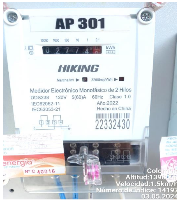
Foto No 7. Medidor No. 22332430 encontrado en terreno instalado y energizado sin encontrarse registrado en el sistema comercial de la compañía con una lectura acumulada de 2776.2 kWh, de los cuales ya se han cobrado 1338 kWh (acta 110030 del 28 de septiembre de 2023) y 758.3 kWh (acta 3014853871 del 19 de diciembre de 2023). Se encuentran pendientes por cobrar 679.9 kWh.