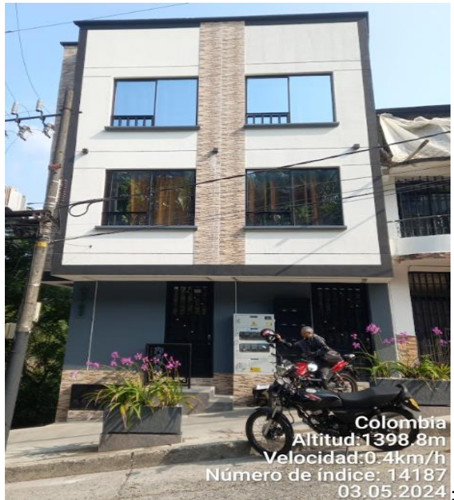
Foto No 1. Vincula el predio con la matricula en revisión