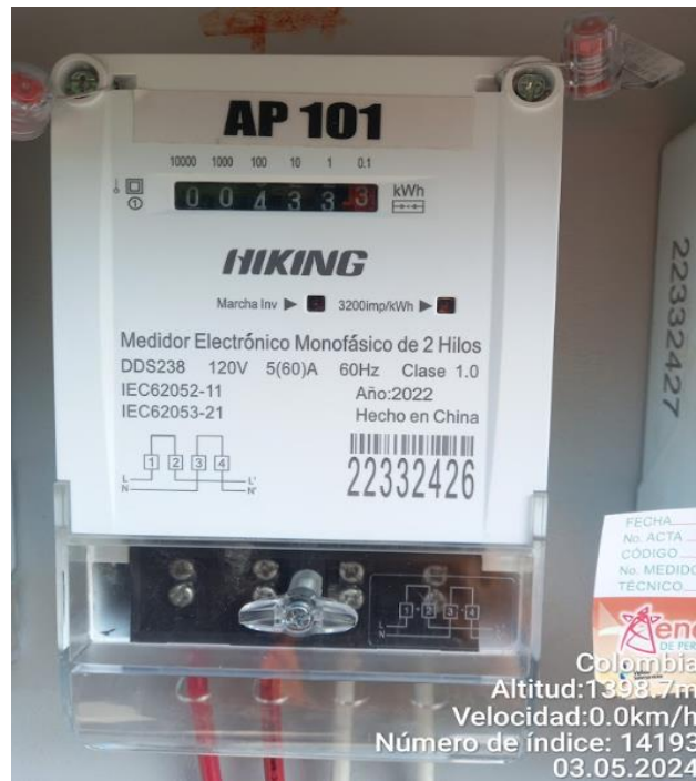
Foto No 3. Medidor No. 22332426 encontrado en terreno instalado y energizado sin encontrarse registrado en el sistema comercial de la compañía con una lectura acumulada de 433.7 kWh, de los cuales ya se han cobrado 232.2 kWh (acta 3014853871 del 19 de diciembre de 2023) y se encuentran pendientes por cobrar 201.5 kWh.