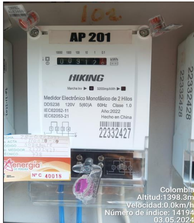
Foto No 4. Medidor No. 22332427 encontrado en terreno instalado y energizado sin encontrarse registrado en el sistema comercial de la compañía con una lectura acumulada de 912.8 kWh, de los cuales ya se han cobrado 446.5 kWh (acta 110030 del 28 de septiembre de 2023) y 249.3 kWh (acta 3014853871 del 19 de diciembre de 2023). Se encuentran pendientes por cobrar 217 kWh.