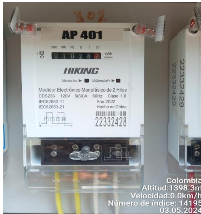
Foto No 5. Medidor No. 22332428 encontrado en terreno instalado y energizado sin encontrarse registrado en el sistema comercial de la compañía con una lectura acumulada de 1028 kWh, de los cuales ya se han cobrado 691.5 kWh (acta 3014853871 del 19 de diciembre de 2023) y se encuentran pendientes por cobrar 336.5 kWh.