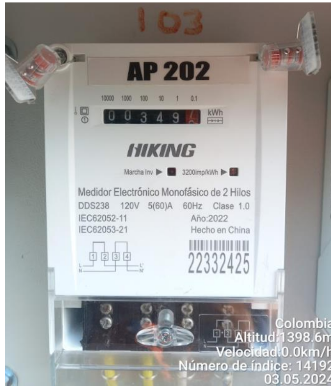
Foto No 2. Medidor No. 22332425 encontrado en terreno instalado y energizado sin encontrarse registrado en el sistema comercial de la compañía con una lectura acumulada de 349.9 kWh, de los cuales ya se han cobrado 78.8 kWh (acta 3014853871 del 19 de diciembre de 2023) y se encuentran pendientes por cobrar 271.1 kWh.