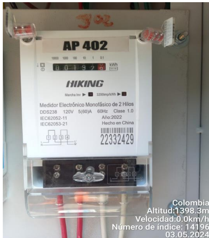
Foto No 6. Medidor No. 22332429 encontrado en terreno instalado y energizado sin encontrarse registrado en el sistema comercial de la compañía con una lectura acumulada de 193 kWh, de los cuales ya se han cobrado 59.9 kWh (acta 3014853871 del 19 de diciembre de 2023) y se encuentran pendientes por cobrar 133.1 kWh.